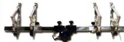
AL 4400 C