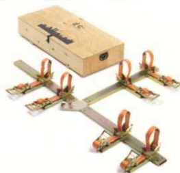
AL 4250 C