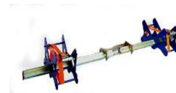
AL 4500 C