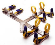
AL 4090 C